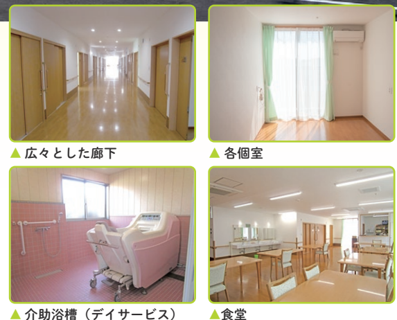
▲ 広々とした廊下 ▲ 個室 ▲ 介護浴槽 (デイサービス) ▲ 食堂