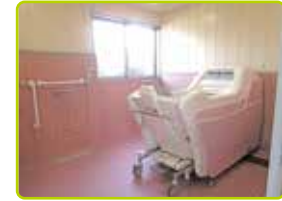
▲ 介浴浴槽(デイサービス)